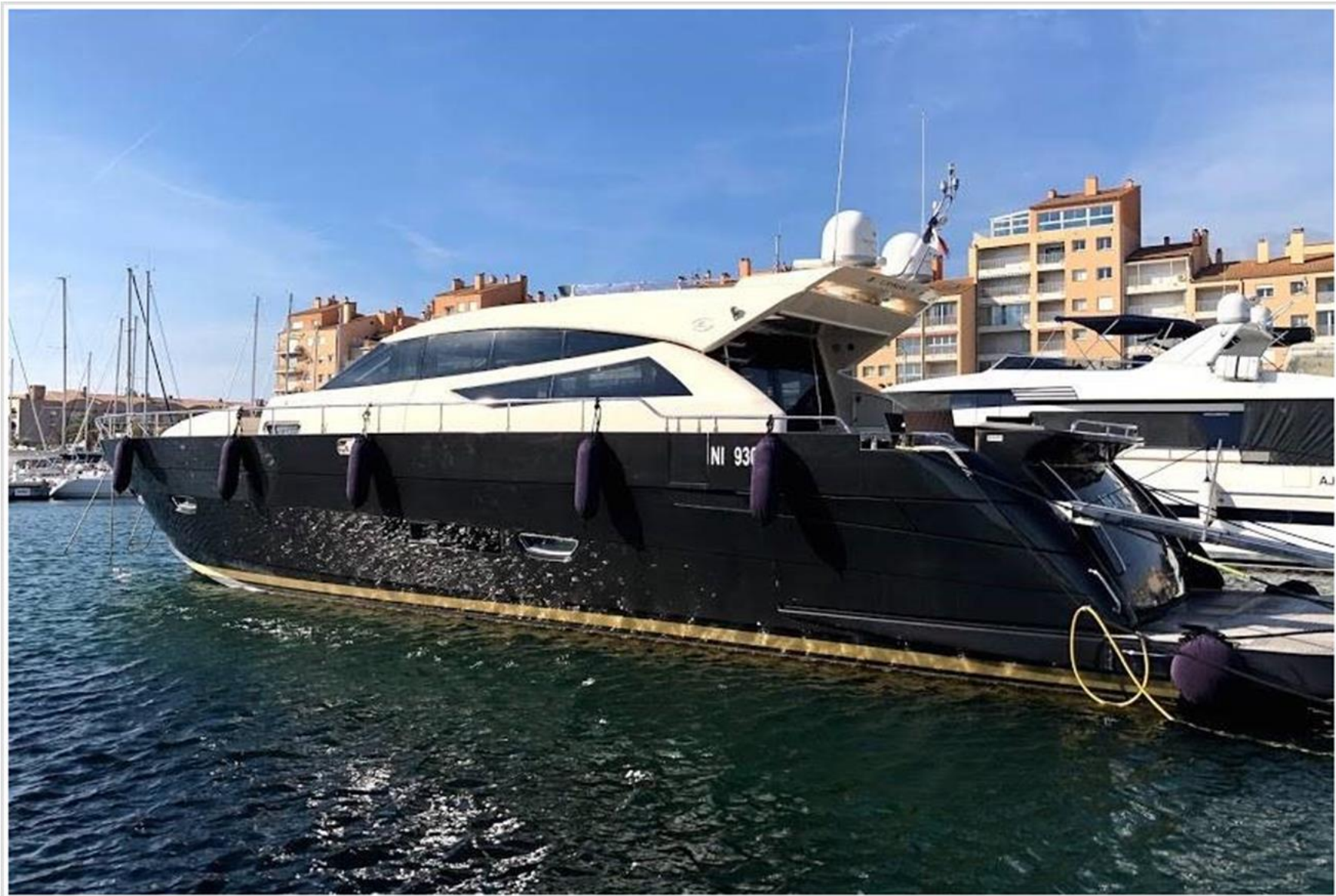
Cayman 75 Ht