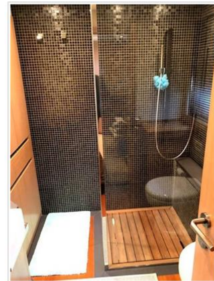
Cayman 75 Ht