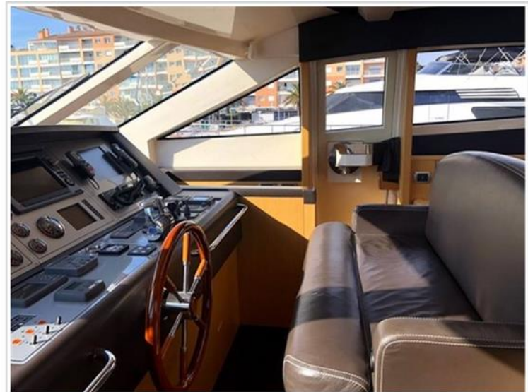
Cayman 75 Ht