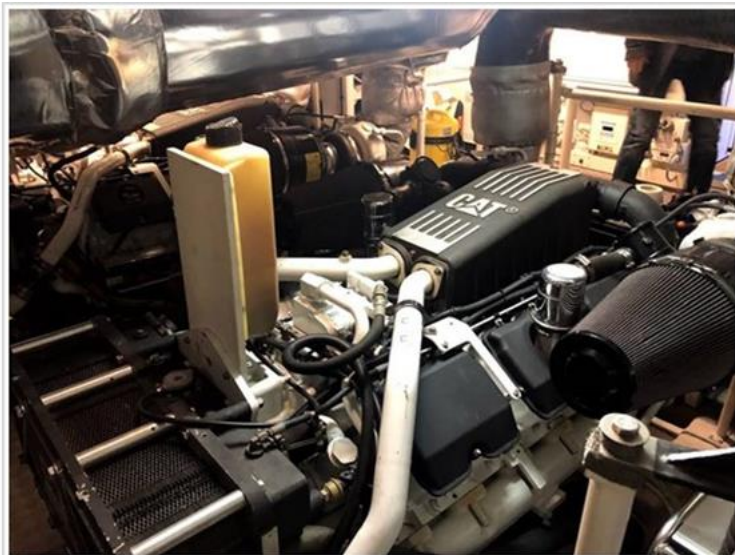
Cayman 75 Ht