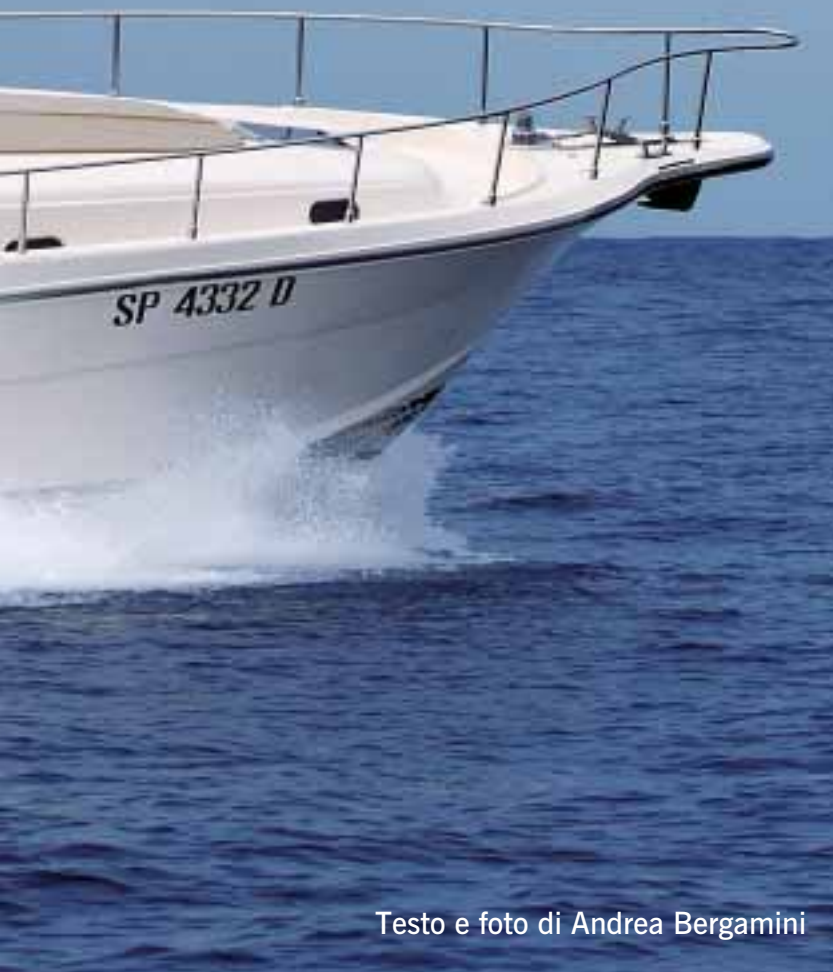
Testo e foto di Andrea Bergamini